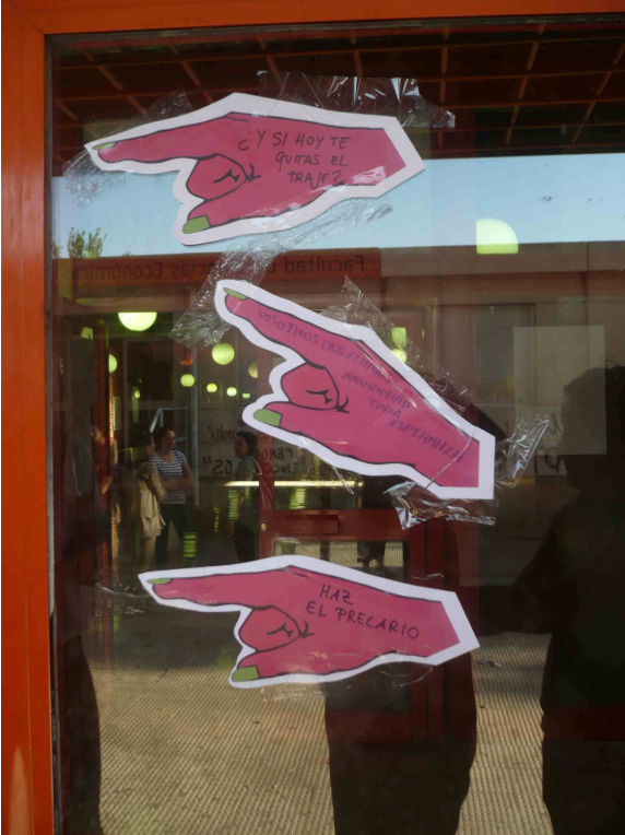
"¿Y si hoy te quitas el traje?", "Vosotros que entráis, abandonad toda esperanza", "Haz el precario"

Eso sí, soy una profesional o al menos así se justifica mi contrato. Pertenezco a ese enorme grupo de gente formada, más bien madura, más bien mujeres, que resulta muy provechosa para el sistema educativo flexible; ahora te cojo sin compromiso, ahora te suelto sin miramientos. Esta forma de inserción precaria se aguanta por varios motivos, y no hablo de los asociados que tienen mesa en el ministerio y les mola figurar como profes; los "verdaderos asociados", que ¡haberlos haylos! El primer motivo es la promesa incierta de introducirse en la institución y mejorar el contrato, algo cada vez más alejado en el horizonte de recortes en el que andamos. El segundo, acumular méritos, evaluables por una agencia (la ANECA) cuyos criterios merecerían una carta aparte, mientras una se dedica a investigaciones por cuenta ajena, más bien propia, puesto que muchos pagan autónomos, por las que facturará estudios externalizados, cada vez peor pagados y lógicamente peores. El tercero, ganar tiempo con medios salarios para ver qué hace una con su vida en un entorno hostil. Eso sí, somos de esa gente que "disfruta trabajando".